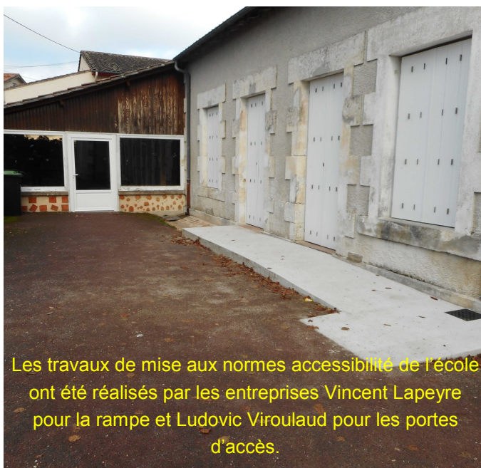
Les travaux de mise aux normes accessibilité de l'école ont été réalisés par les entreprises Vincent Lapeyre pour la rampe et Ludovic Viroulaud pour les portes d'accès.