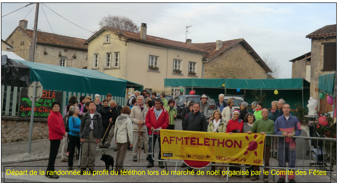
Départ de la randonnée au profit du téléthon lors du marché de Noël organisé par le Comité des Fêtes