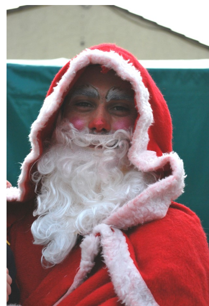
Le Père Noël était de passage à Augnac le 23 novembre

Ce message fait office de convocation. Pour tout renseignement s'adresser à M Gilles COMBEAU au 06 50 02 92 91 ou à la Mairie d'Augnac.