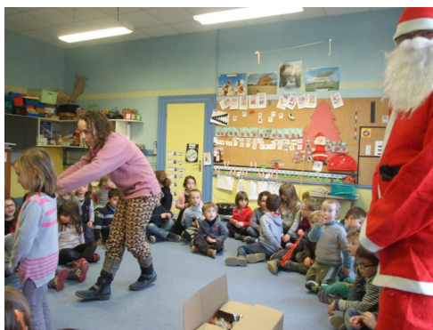
Le Père Noël à l'école Maternelle ☺

Tous les bénéfiques ont permis aux enfants des écoles de réaliser des sorties pédagogiques et culturelles en extérieur (L'amicale Laïque finance le transport pour chaque sortie), mais aussi :