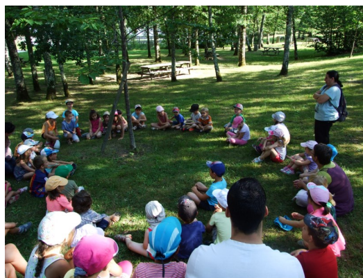
Sortie de fin d'Année scolaire 2017 à l'étang de Saint Estèphe